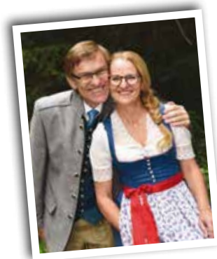
ALMGUT****SUPERIOR MOUNTAIN WELLNESS