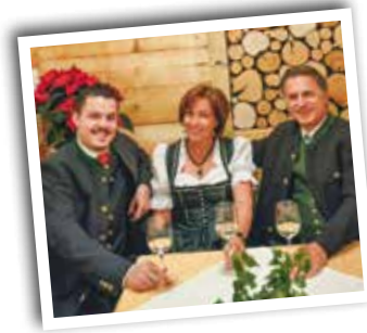
HOTEL „HÄUSERL IM WALD“ ****