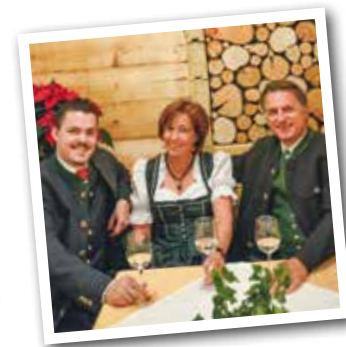
HOTEL „HÄUSERL IM WALD“ ****