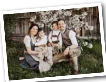
LANDGASTHOF & BIOBAUERNHOF DER LÖCKERWIRT